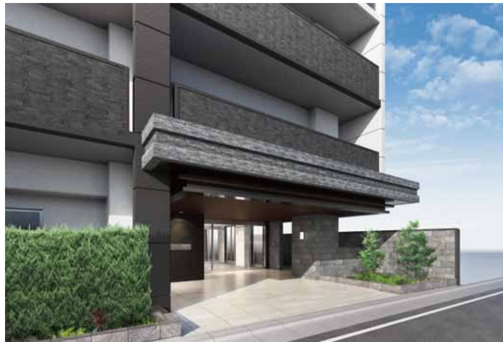
※掲載の外観・敷地完成予想図は設計図面と現地写真を基に描き起こしたもので、実際とは異なる場合があります。照明や日光により色味が異なって見える場合があります。また、植栽は竣工時ではなく生育後を想定して描いております。予めご了承ください。