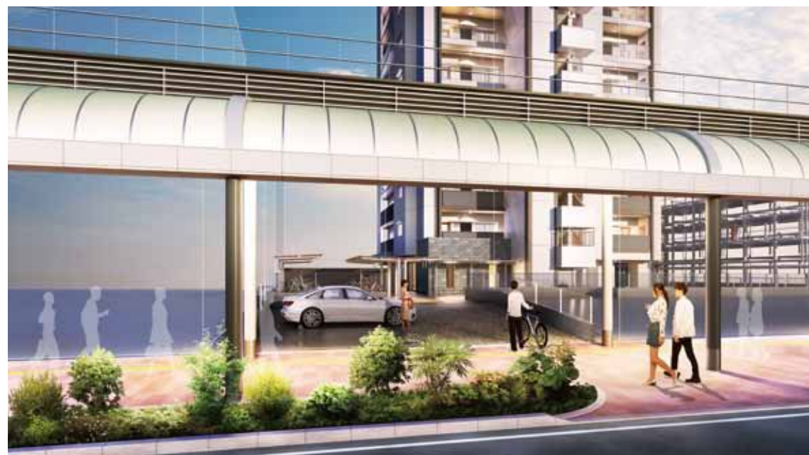
※掲載の外観・敷地完成予想図は設計図面と現地写真を基に描き起こしたもので、実際とは異なる場合があります。照明や日光により色味が異なって見える場合があります。予めご了承ください。