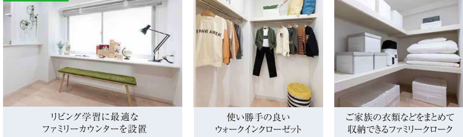
リビング学習に最適なファミリーカウンターを設置 使い勝手の良いウォークインクローゼット ご家族の衣類などをまとめて収納できるファミリークローゼット