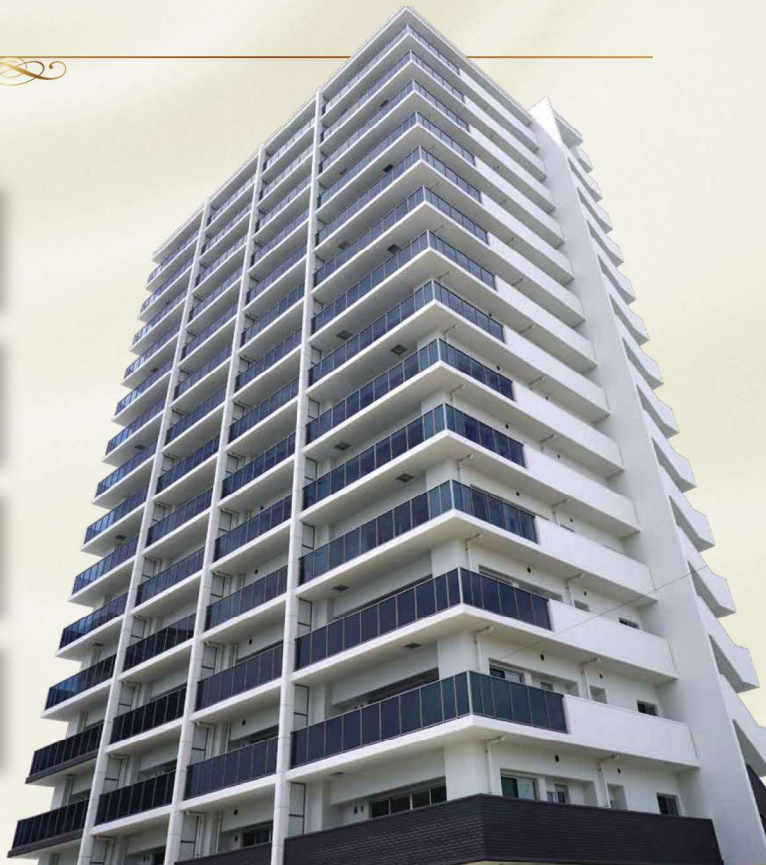
※外観写真は2026年6月に撮影し、CG加工を施したものです。表示距離は地図上の概測距離で、徒歩所要時間は80m/分で算出しています。