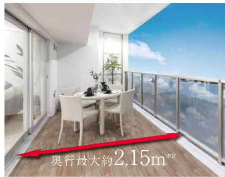
開放感あるガラス手摺 ※1 採用の奥行最大約2.15m ※2 全戸ワイドバルコニー ※1:一部住戸を除く。 ※2:壁芯寸法です。

※WICはウォークインクローゼット、FCはファミリークローゼットの略です。 住居専有面積 / 81.23㎡ (24.57坪) M B 面積 / 0.72㎡ (0.21坪) バルコニー面積 / 30.49㎡ (9.22坪) 合計面積 / 112.44㎡ (34.01坪)