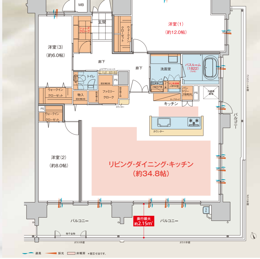
※WICはウォーキングクローゼット、FCはファミリークローゼット、SCはシューズクローゼットの略です。