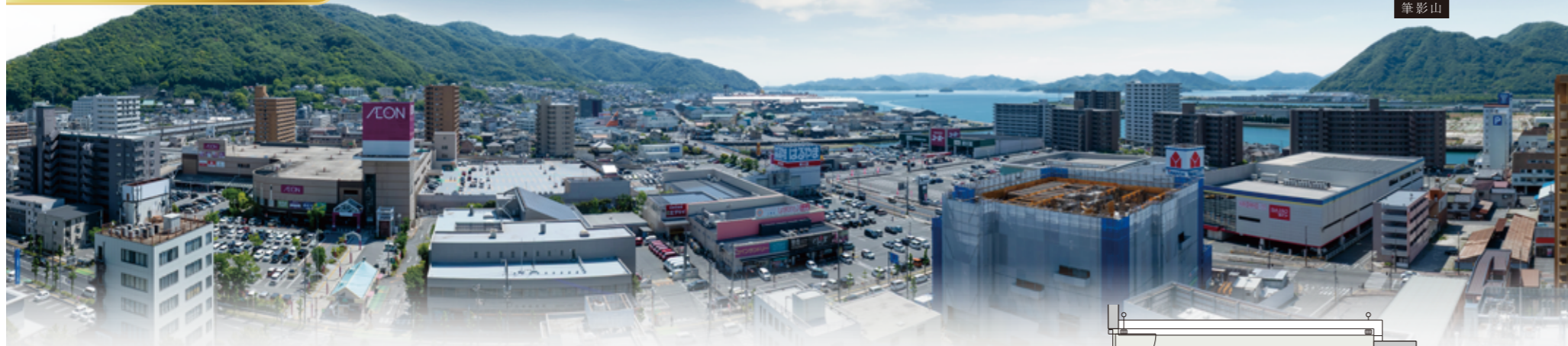
※掲載の写真は現地15階相当の高さから撮影(2026年5月)し、CG加工を施したもので実際とは異なります。 ※眺望は住戸階数や住戸タイプにより異なります。また、将来に達して保証されるものではありません。